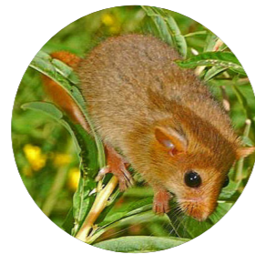
Muscardin ( Muscardinus avellanarius )