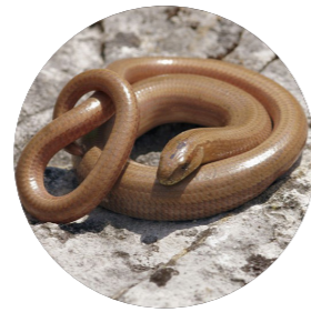
Orvet fragile ( Anguis fragilis )