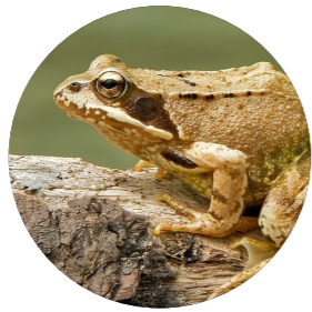
Grenouille rousse ( Rana temporaria )