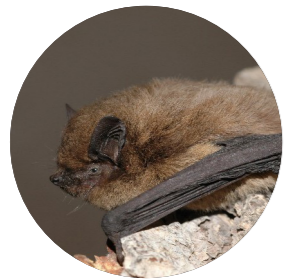
Pipistrelle de Nathusius ( Pipistrellus nathusii )