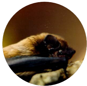
Noctule de Leisler ( Nyctalus leisleri )