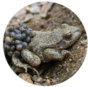
Alyte accoucheur ( Alytes obstetricans )