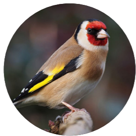
Chardonneret élégant ( Carduelis carduelis )