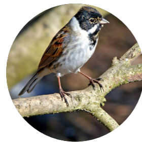
Bruant des roseaux ( Emberiza schoeniclus )