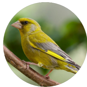
Verdier d'Europe ( Chloris chloris )