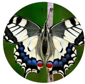
Machaon ( Papilio machaon )