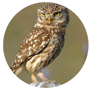
Chevêche d'Athéna ( Athene noctua )